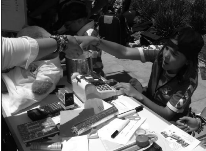
Transacción comercial en el mercado celebrado en Málaga