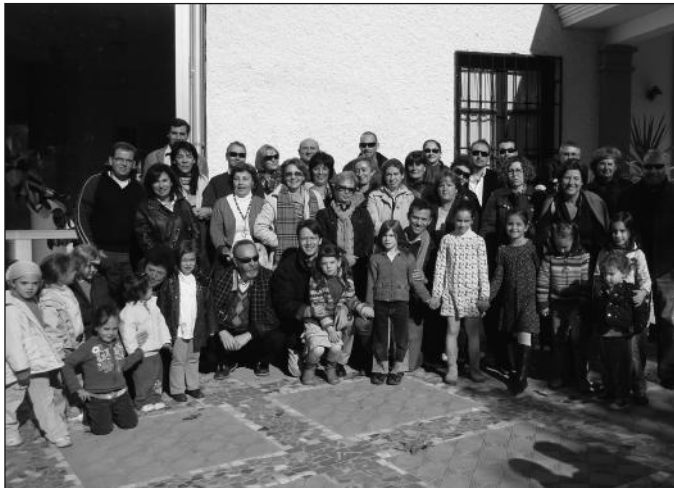
Participantes en la reunión de planificación del proyecto EME celebrada en Granada