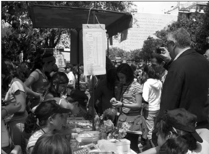
Visita al Mercado de Emprendedores Escolares en Oviedo.