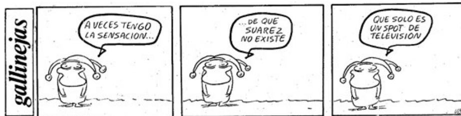
Imagen 1. Adolfo Suárez y el “síndrome de La Moncloa”

El distanciamiento de Adolfo Suárez de la vida política venía siendo un clamor desde su investidura como jefe del Gobierno en marzo de 1979. Lo que acabaría por convertirse en el “síndrome de La Moncloa”, como diagnóstico a su arrinconamiento (Brey, 2016) sería, en mayo del mismo año, motivo de inspiración para el humor gráfico de la época (Imagen 1). A lo largo toda la legislatura, el Gobierno en general y Suárez en particular serían acusados de no saber gestionar la crisis que atravesaba la sociedad española. Crisis económica, crisis política y crisis ante la oleada terrorista.