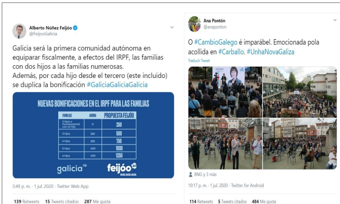
Imagen 1. Ejemplos de tuits relativos a economía (Feijóo) y cambio político (Pontón)