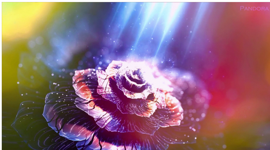
Figura 1 . Captura de imagen extraída del GIF que acompaña a la nasheed analizada