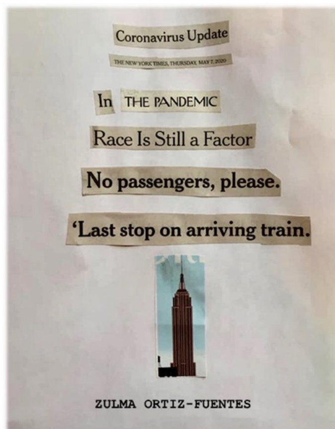
Imagen 4: Zulma Ortiz-Fuentes, “Coronavirus Update”, Brevirus, antología de minificaciones , ed. Lilian Elphick Latorre, Santiago de Chile: Brevilla, 2020, p. 79. https://www.lettrasdechile.cl/home/images/pdf/brevirus_2020.pdf (consultado el 4/1/22)

un efecto Covid (Sullivan 2020). Al inventar recorridos entre elementos heterogéneos y producir relaciones entre los signos, la artista se dedica a una experimentación semionáutica (Bourriaud 2000) cuyo resultado es una minificación hipermedial (Calvo Revilla 2019, 151). Aprovechando la apertura y la pluralidad significativa de este tipo de creación y tomándose libertad con los vestigios de puntuación, propongo a continuación una lectura optimista de este collage de índole caligramático. La denuncia de la responsabilidad del racismo en la muerte de las principales víctimas de la Covid-19 en Nueva York (“In the pandemic, race is still a factor” [79]) precede a la afirmación de que con la llegada del último tren (¿de la última ola?), esto tendrá que parar (“No passengers please, last stop on arriving train” [79]). Símbolo de vida, la forma de árbol, con el tronco-Empire State Building sobre un fondo azul, sugiere que Nueva York se recuperará. En fin, la crítica social (con la probable alusión a un virus que sí discrimina, dando lugar a una “pandemia de clase, género y raza” (Harvey 93) que resalta injusticias ya existentes, a las cuales se tiene que poner fin) es compatible con la esperanza.