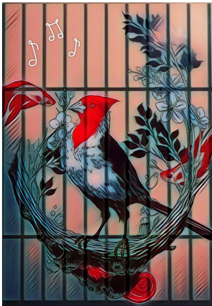
Fotografía Pájaro enjaulado .

El rey del rock sale a escena. Toma el micrófono. Canta, se contonea. Se convierte en el pájaro más bello de la jaula. Aunque tenga el buche lleno de alcohol y pastillas, su deseo es no estar fuera de la fiesta. Así, noche a noche, el escenario se convierte en el agujero por donde el miedo a vivir se convierte en canción conjurando la realidad.