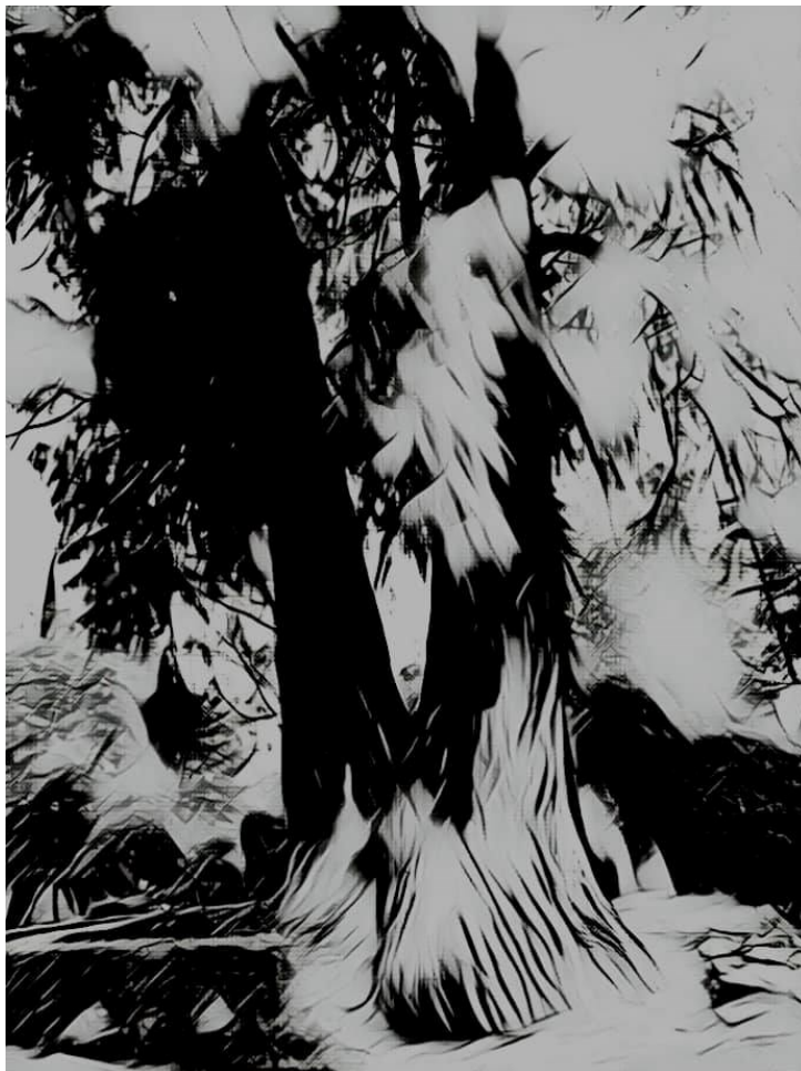
Fotografía Árbol negro © Angélica Santa Olaya D. R.

murió. Sus hijos, inconsolables, lloran.