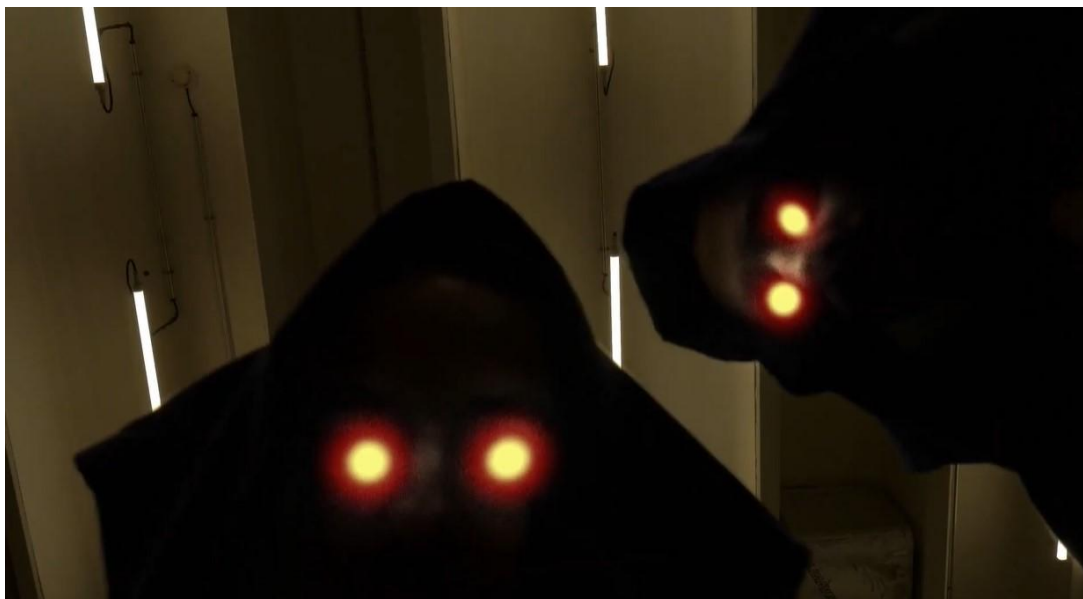
Imagen 1. Seres. Ojos