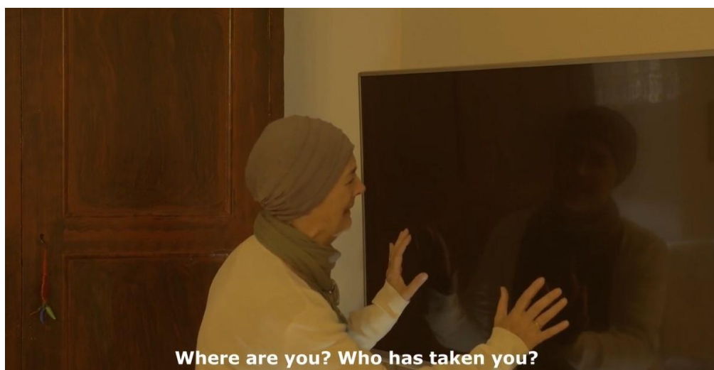
Imagen 3. ¿Quién te ha llevado?

Esta explicación se hace necesaria para ubicar a los estudiantes en el contexto a partir del cual se va a trabajar en el aula, si bien se puede realizar antes o después del visionado de la película.