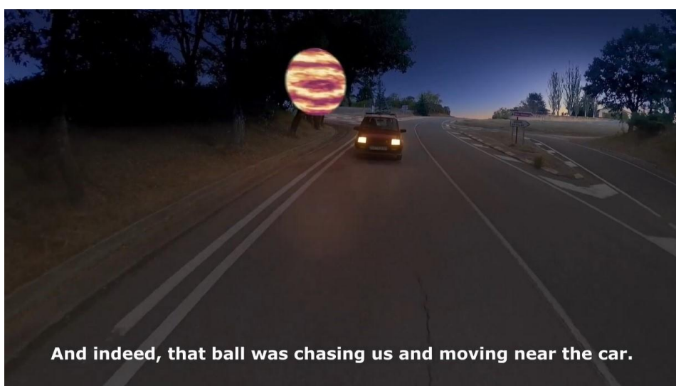
Imagen 2. Esfera. Carretera

De forma más concreta, el cortometraje Abducción está inspirado en el fenómeno de abducción ocurrido en Muru-Astráin, una localidad de la cuenca navarra en el año 1983; su director se permite ciertas licencias narrativas para explorar los acontecimientos tan extraños como el que vivió un matrimonio abducido, perseguido primero por una esfera luminosa en plena carretera y posteriormente interceptado su vehículo por un extraño objeto volador, que se posó frente a ellos para introducirlos en su interior y realizar ciertas intrusiones en sus cuerpos, parece que siendo examinados en contra de su voluntad.