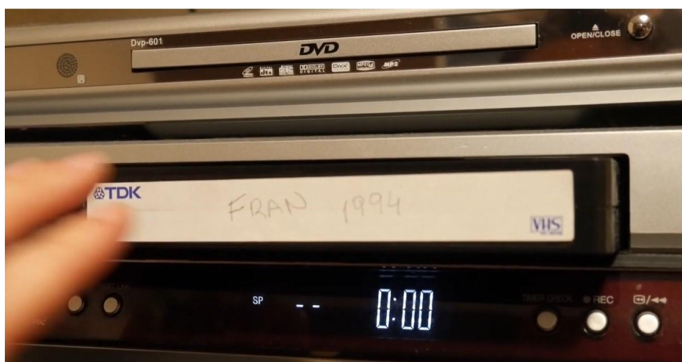
Imagen 5. Cinta VHS

Se observa cómo la existencia del tiempo es muy relativa pues actúa como anagnórisis literaria, es decir, el lapso que se cree perdido en el vacío, la conciencia de su desaparición se recupera y se hace ostensible en una cinta de vídeo, tal y como se observa en el fotograma, grabada por Fran, el marido enfermo que se erige en el emisario de aquellos seres inhóspitos y hasta exóticos, lejanos y adivinadores, anunciantes de alguna premonición: tres son los mensajes que se van a expresar por boca del humano y tan solo dos llegan a escucharse.