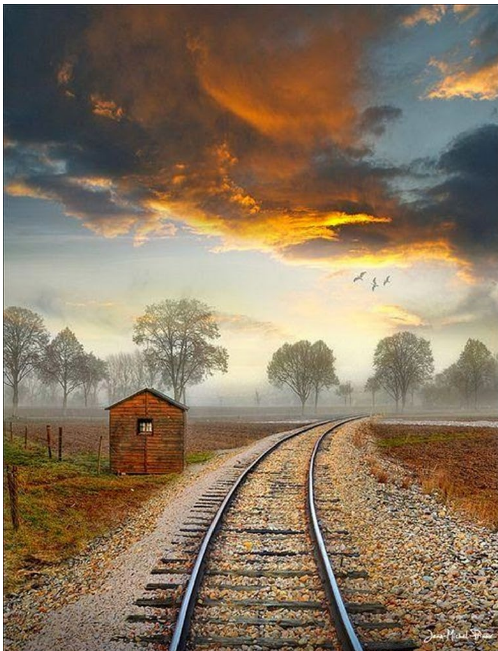
Train Station. Alsace, France.

Salgo del tren a la sala de espera y nadie está por mí, es más, no hay un alma en el lugar. Estoy completamente solo.