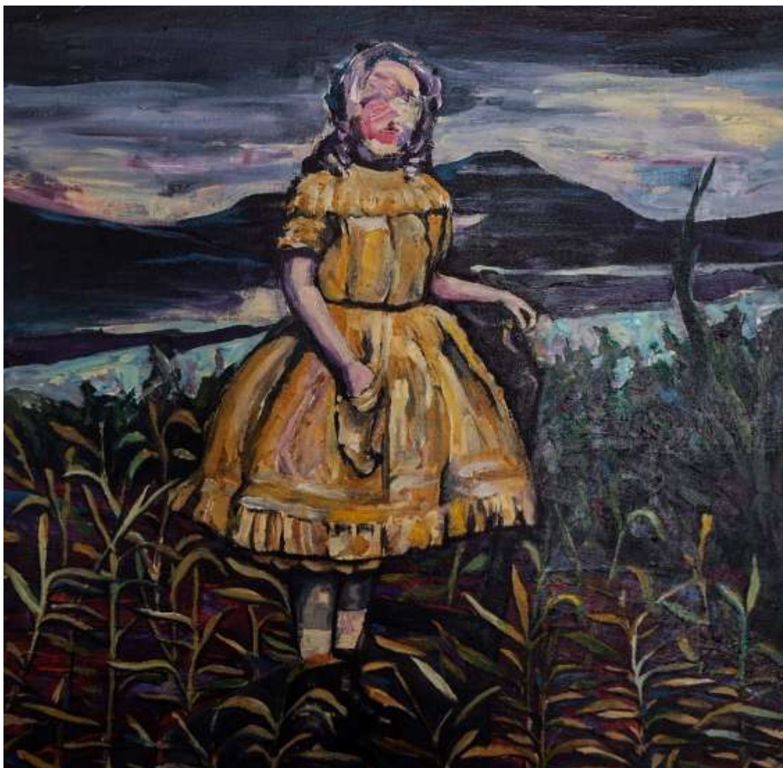
Imagen "La niña del bosque". Acrílico sobre lienzo, de Mariano Piantoni

El telar estuvo listo. Entonces comenzamos a deshilarla. Tomamos hebras con esa prescripción áurea que se nos había requerido, sin alterar ninguna pauta. Buscamos la inclinación lunar y cada uno fue aportando su empeño, su dedicación, su observación y su detalle. Lo más difícil, tal vez, fue acomodar el alma. Porque todas las cosas precisan de precisión. De precisión y de paciencia. Y cuando todo estuvo listo, en el tiempo indicado, la corporeidad fue adquiriendo la forma que se nos había indicado. Y después, la liberamos. Y allá quedó, en el bosque.