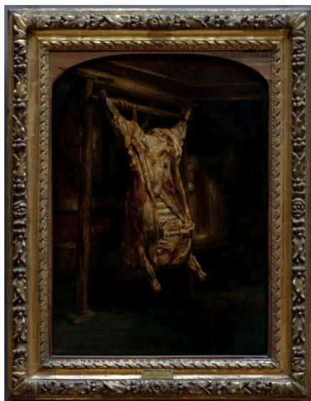
Fig. 3 – Boi Abatido (1655), de Rembrandt.