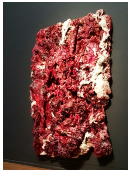
Fig. 4 – Internal Object in Three Parts (2013-2015), de Anish Kapoor.